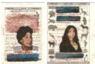
Juan Castillo (Antofagasta, 1952) Sin título de la serie La lengua , 1988 Gráfica y pintura s/papel con película de cera 26 x 18,3 cm c/u Colección MAC / Donación Bicentenario