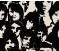
Aníbal Ortíz Pozo (Ovalle, 1937) Para sumar y construir de la serie Tren de la Cultura , 1971 Serigrafía s/papel 55 x 65 cm Colección MAC / Restaurada