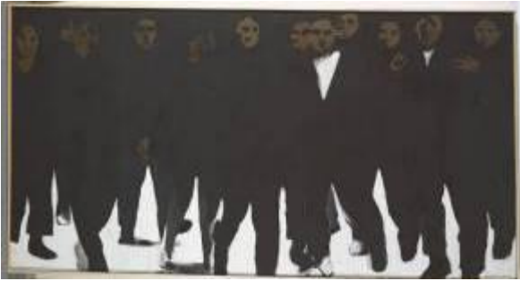
Gracia Barrios (Santiago, 1927) América no invoco tu nombre en vano , 1970 Técnica mixta s/tela 160 x 301 cm Colección MAC/ Restaurada