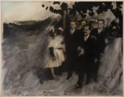
Enrique Zamudio (Santiago, 1955) Pedro Aguirre Cerda de la serie Los presidentes , 1987 Fotoemulsión, óleo y fotoserigrafía s/tela 180 x 240 cm Colección MAC / Donación Bicentenario