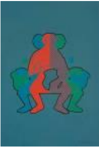
Martínez Santander Sin título de la serie Tren de la Cultura , 1971 Serigrafía s/papel 76 x 53 cm Colección MAC / Restaurada