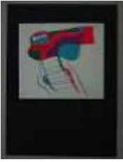
Guillermo Núñez (Santiago, 1930) Sin título , 1973 Serigrafía s/papel 25 x 18 cm Colección MAC