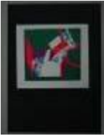
Guillermo Núñez (Santiago, 1930) Sin título , 1973 Serigrafía s/papel 25 x 18 cm Colección MAC