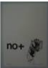
Guillermo Núñez (Santiago, 1930) Sin título , ca. 1978 -79 Serigrafía s/papel 20,9 x 14,6 cm Colección MAC