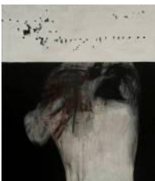
José Balmes (Barcelona, 1927) Vietnam herido , 1969 Técnica mixta s/tela 179 x 153 cm Colección MAC / Restaurada