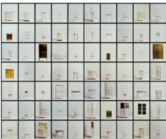
Josefina Guilisasti (Santiago, 1963) Dos camas un velador una silla y un cristo , 1999 Instalación fotográfica Dimensiones variables (35 x 30 cm c/u de las 70 fotos enmarcadas) Colección MAC / Donación Bicentenario