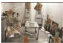
Juan Castillo (Antofagasta, 1952) Sin título , 1989

Pintura acrílica s/papel y registro fotográfico en color de performance 225 x 385 cm Colección MAC / Donación Bicentenario / Restaurada