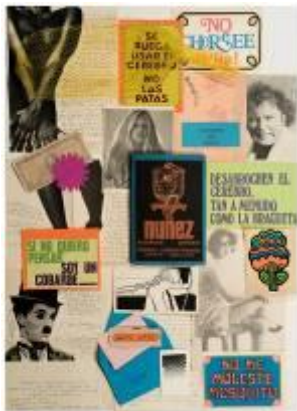
Guillermo Núñez (Santiago, 1930) Núñez, exculturas, printuras , 1975 Obra objetual Dimensiones variables Colección MAC