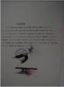
Guillermo Núñez (Santiago, 1930) Sin título , ca. 1980 Serigrafía y técnica mixta s/papel 65,5 x 50,5 cm Colección MAC