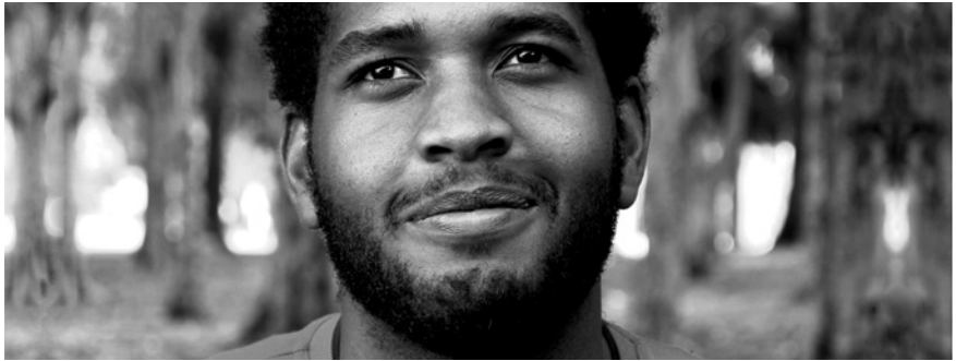
© VALERIO ROCCO ORLANDO, ¿Qué Educación para Marte? , 2012.

PALABRAS CLAVE: EDUCACIÓN • ESTUDIANTES • DRAMATURGIA SOCIAL • DISCUSIÓN