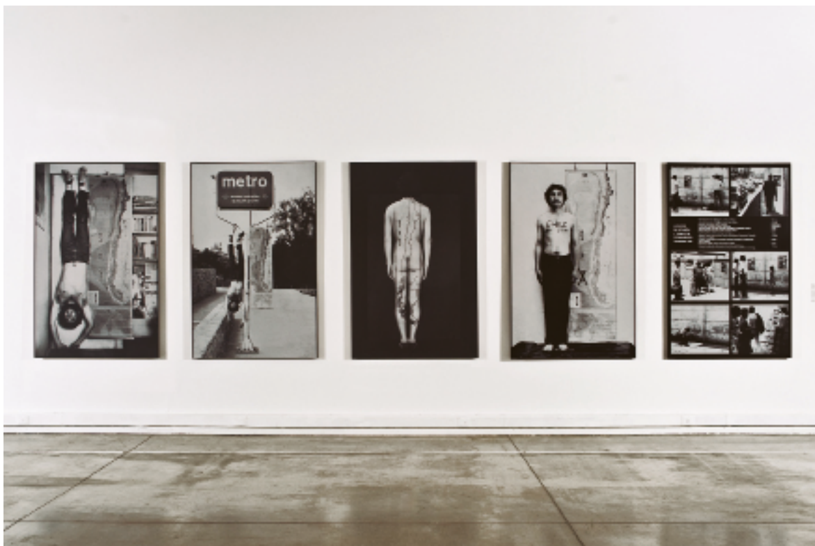
© Elías Adasme.

INVENTARIO 773 FORMA DE INGRESO Donación del artista en 2009 EXPOSICIONES XII Bienal de París , Museo de Arte Moderno de París, París, 1982 • Chile años 70 y 80. Memoria y experimentalidad , Museo de Arte Contemporáneo, Santiago, 2011–2012